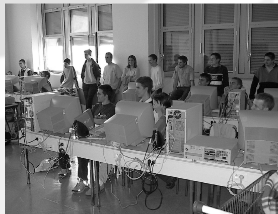
Install-party à l'UTBM

Lolut est le club des utilisateurs de Logiciels Libres de l'Université de Technologie de Belfort-Montbéliard. L'UTBM est une école publique délivrant un diplôme d'ingénieur généraliste de haut niveau. Elle propose quatre formations : génie informatique, génie des systèmes de commande, génie des systèmes de production, génie mécanique et conception.