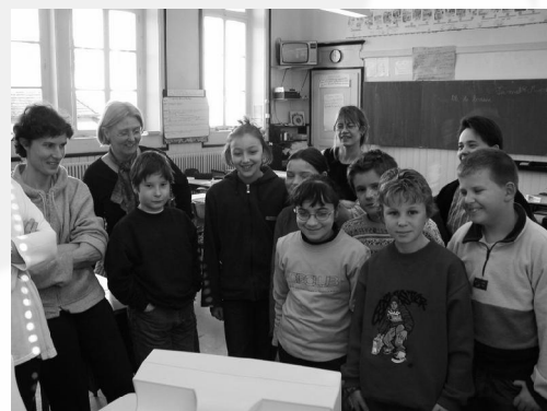
Journées du Libre dans l'éducation, Bucey les Gy (70)